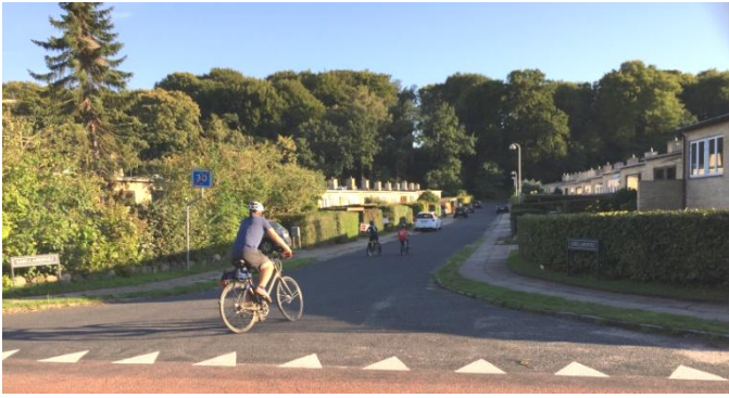
Foto: 'Rækkehusområdet ved Egegårdsvej' – et af Lundtoftes bykvarterer. I baggrunden et overordnet landskabstræk: Troldehøj-området mv.

Se vedlagte 'pilotområde-oplæg' (= afsnit A.2. herunder)