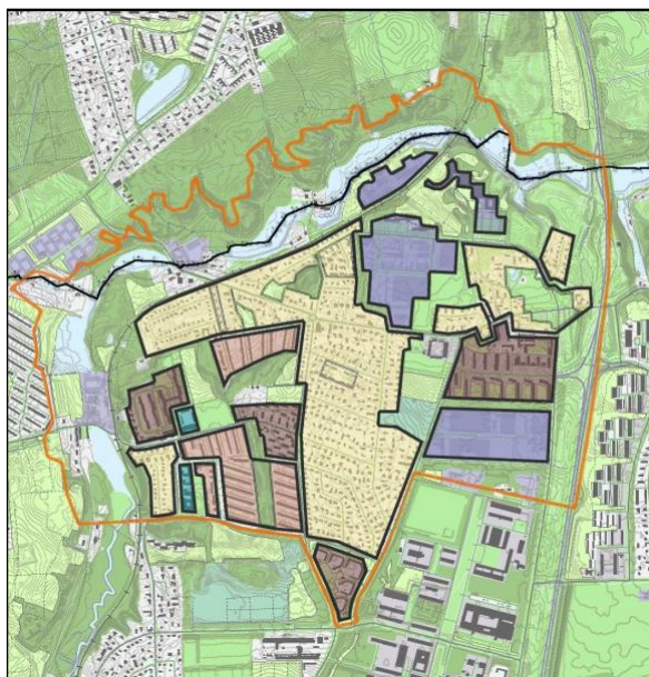
Lundtofte: Foreløbig kvartersinddeling

Arbejdsgruppen har skitseret en egnet metode og har udpeget og kortlagt områdets bykvarterer, grønne områder og dominerende landskabstræk. Metoden er derefter blevet afprøvet i to pilot-områder, hhv. bykvartererne 'S. Willumsensvej kvarteret' og 'Rækkehusområdet ved Egegårdsvej'.